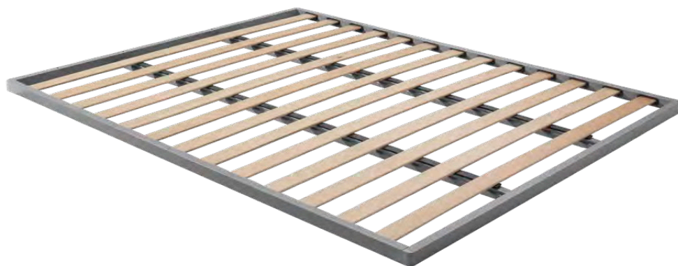
Doga unica Single slat