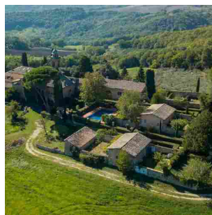
Tre proprietà esclusive nel cuore dell'Umbria