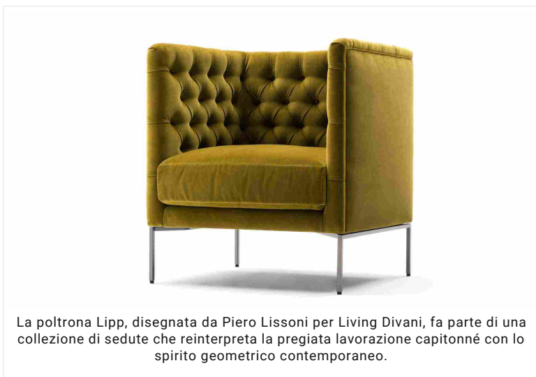
La poltrona Lipp, disegnata da Piero Lissoni per Living Divani, fa parte di una collezione di sedute che reinterpreta la pregiata lavorazione capitonné con lo spirito geometrico contemporaneo.

Il velluto è tornato protagonista non solo per divani e poltrone, ma per tutti gli imbottiti dall'anima sontuosa. Come cuscini, pouf o per rivestimenti inusuali di specchi e paraventi come Mascha di Opera Contemporary , in contrasto con la struttura in ottone spazzolato per emanare un'atmosfera cool contemporanea. Inutile dire che il velluto oltre che un must di stagione, è sempre sinonimo di eleganza e raffinatezza. Una scelta che non delude e che dura nel tempo, fuori da ogni moda passeggera.