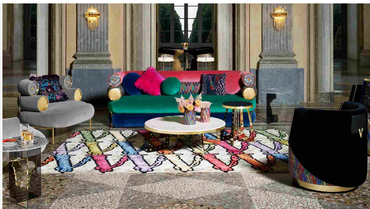
La sofisticata collezione Virtus di Versace Home con i vari pezzi di design caratterizzati dal simbolo della V barocca.

Articolo tratto dal numero invernale di Robb Report